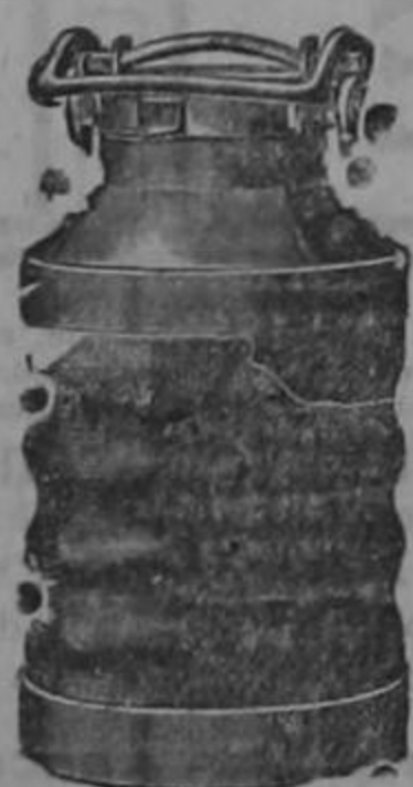
Almacenes al por mayor